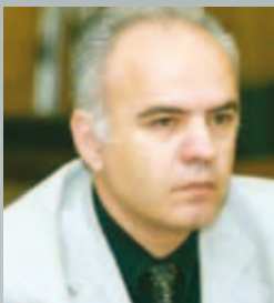
Φώτης Χατζημιχάλης Ο πρώτος Γενικός Γραμματέας της Αποκεντρωμένης Διοίκησης Αιγαίου

Έτσι λοιπόν από 1/1/2011 ξεκινά η λειτουργία αφενός της αιρετής Περιφέρειας Νοτίου Αιγαίου, στην οποία υπάγονται οι Κυκλάδες και τα Δωδεκάνησα με πρώτο εκλεγμένο Περιφερειάρχη τον κ. Γιάννη Μαχαιρίδη και αφετέρου η Αποκεντρωμένη Διοίκηση Αιγαίου που περιλαμβάνει τις Περιφέρειες Βορείου και Νοτίου Αιγαίου στην οποία ορίστηκε Γενικός Γραμματέας ο κ. Φώτης Χατζημιχάλης.