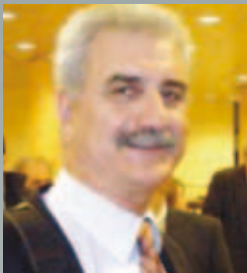
Γιάννης Μαχαιρίδης Ο πρώτος εκλεγμένος Περιφερειάρχης Νοτίου Αιγαίου

Η εφαρμογή του Προγράμματος Καλλικράτης (Νόμος 3852/2010) αλλάζει τα δεδομένα στη λειτουργία του Κράτους και της Αυτοδιοίκησης. Με τους νέους θεσμούς της αιρετής περιφερειακής αυτοδιοίκησης και της αποκεντρωμένης διοίκησης και τη μεταφορά νέων αρμοδιοτήτων από το κράτος στην περιφέρεια, σημαντικές είναι οι αλλαγές και στη διαχείριση των Προγραμμάτων του ΕΣΠΑ.