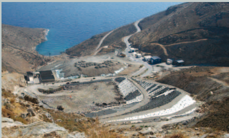
Ο ΧΥΤΑ της Σύρου

Ένας ενδεδειγμένος τρόπος για την αντιμετώπιση αυτού του προβλήματος είναι η δημιουργία μεγάλων στεγανών λεκανών στο έδαφος, μέσα στις οποίες γίνεται η διάθεση των απορριμμάτων. Τα απορρίμματα τοποθετούνται σε στρώσεις ύψους 2-3 μέτρων, συμπιέζονται και καλύπτονται με χώμα στο τέλος κάθε ημέρας. Ένας τέτοιος χώρος ονομάζεται Χώρος Υγειονομικής Ταφής Απορριμμάτων (ΧΥΤΑ) και κατασκευάζεται με τέτοιο τρόπο ώστε να εμποδίζονται ή να ελαχιστοποιούνται οι αρνητικές επιπτώσεις στο περιβάλλον από τους ρύπους, όπως είναι τα στραγγίσματα, το βιοαέριο, τα μικροαπορρίμματα, οι οσμές κτλ. Όταν ο ΧΥΤΑ γεμίσει, καλύπτεται με χώμα πάχους 1 μέτρου περίπου και αφού στεγανωθεί, επαναφέρεται στην αρχική του κατάσταση και για ένα χρονικό διάστημα παρακολουθείται συστηματικά, γιατί εξακολουθεί να παράγει ρύπους όπως είναι το βιοαέριο ή τα στραγγίσματα. Αφού γίνουν οι κατάλληλες