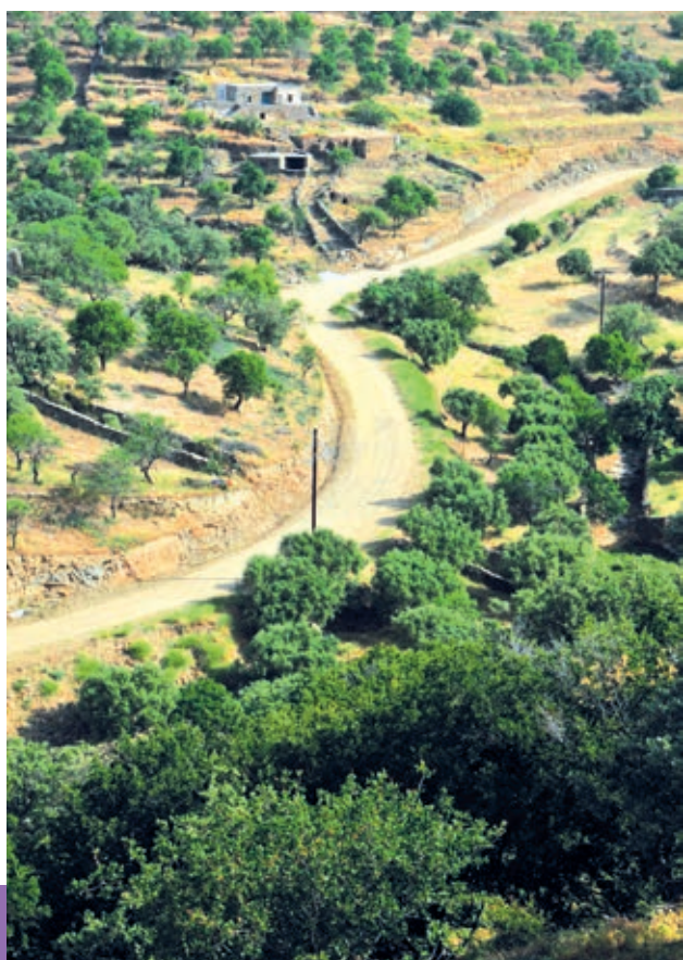
Δρόμος Καμπί - Χαβουνά - Κάτω Μεριά