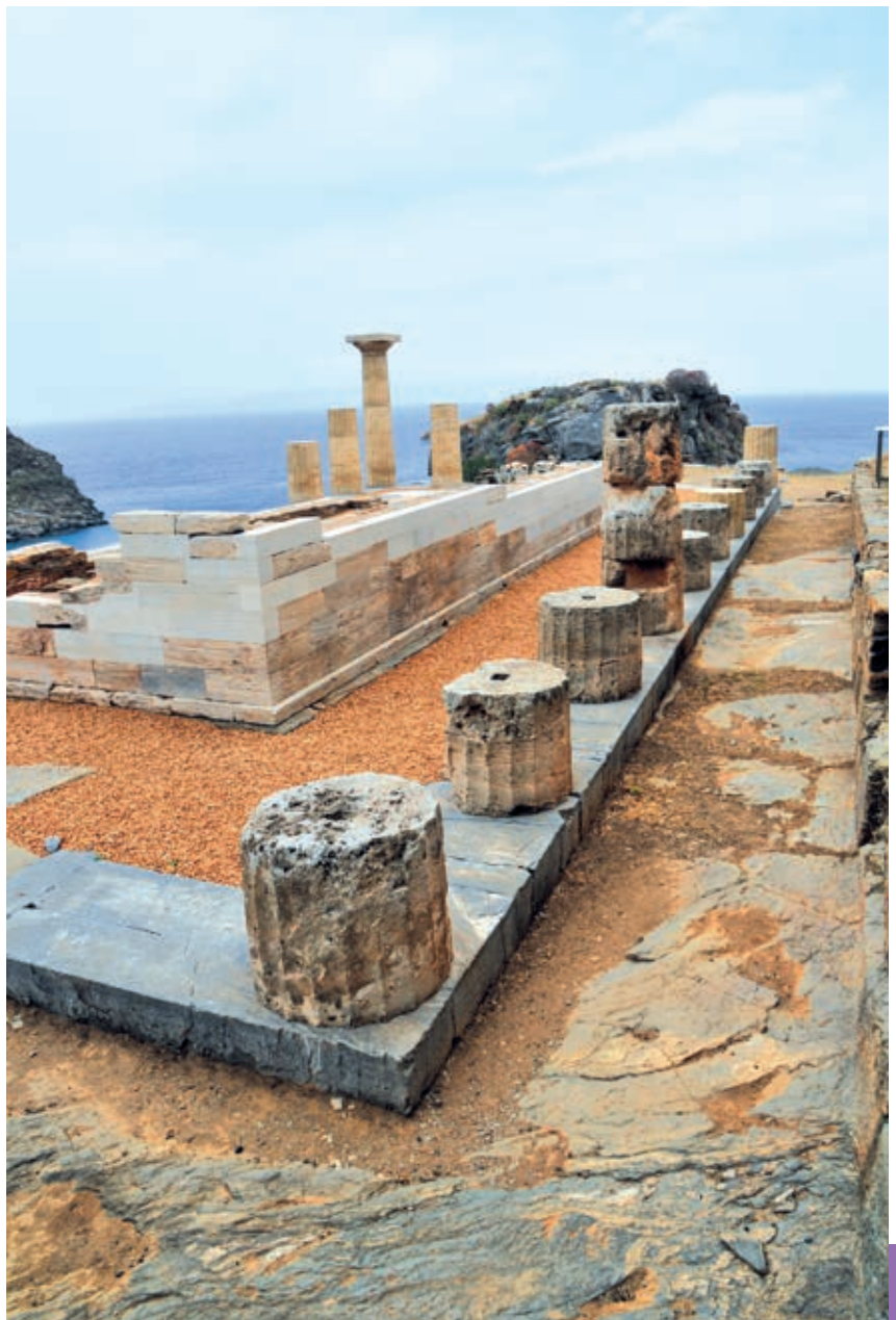
Αρχαιολογικός χώρος Καρθαίας

Στην ίδια περιοχή, στο νοτιοανατολικό τμήμα της Κέας, βρίσκεται ο σημαντικός αρχαιολογικός χώρος της Καρθαίας , αποκομμένος από το οδικό δίκτυο του νησιού. Το Πρόγραμμα χρηματοδοτεί με 900 χιλ. ευρώ την ολοκλήρωση του αναστηλωτικού προγράμματος των τεσσάρων πλέον επιβλητικών οικοδομημάτων της αρχαίας πόλης-κράτους η υλοποίηση του οποίου ξεκίνησε με πόρους του Γ' Κοινοτικού Πλαισίου Στήριξης. Προβλέπεται λοιπόν η στερέωση του σωζόμενου τμήματος του ναού του Απόλλωνα, η αναστήλωση του προπύλου και η αποκάλυψη και στερέωση του θεάτρου, αλλά και η έκδοση ενημερωτικού υλικού που θα γίνει και στο σύστημα Μπράιγ.