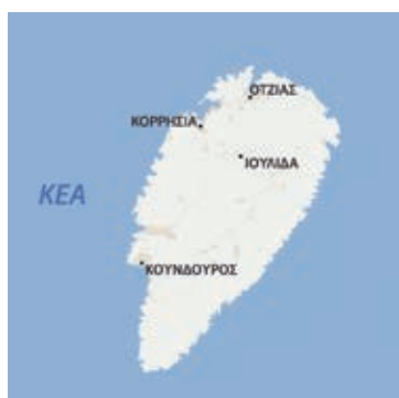
Η Κέα έχει έκταση 130,6τ.χλμ. και πληθυσμό 2.420 κατοίκους. Πρωτεύουσα του νησιού είναι η Ιουλίδα και κύριο λιμάνι της η Κορρησία

Η Κέα θα λέγαμε ότι είναι ένα νησί που δεν ευνοήθηκε ιδιαίτερα τα προηγούμενα χρόνια από το 3ο Κοινωνικό Πλαίσιο Στήριξης, καθώς δεν έγινε δυνατό να καλυφθούν με τους πόρους του σημαντικές ελλείψεις σε υποδομές. Για την κάλυψη αυτών των αναγκών επιστρατεύθηκε ένα σημαντικό κομμάτι των πόρων του ΕΣΠΑ που διατίθενται στα νησιά μας. Έτσι με έργα ανάδειξης του πολιτισμού, προστασίας του περιβάλλοντος, οδοποιίας και εκπαίδευσης, που ο προϋπολογισμός τους ξεπερνά ήδη τα 13,5 εκ. ευρώ, γίνεται μια συντονισμένη προσπάθεια για την πολύπλευρη ανάπτυξη του νησιού.