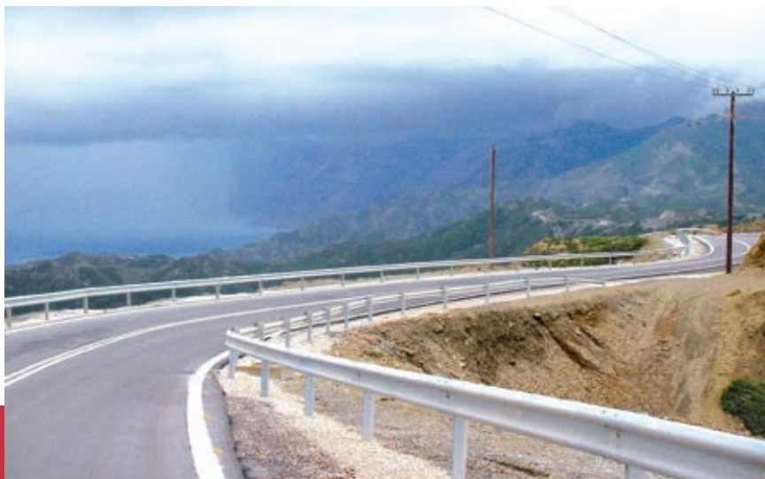
Δρόμος Σπόα – Όλυμπος