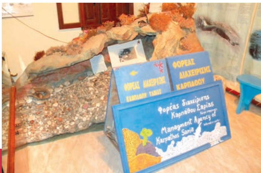
Από τα γραφεία του Φορέα Διαχείρισης Καρπάθου - Σαρίας