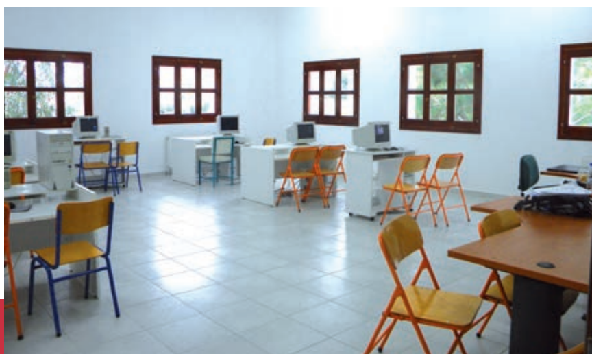
Η αίθουσα πληροφορικής στο Σχολικό Συγκρότημα Απερίου

Συνολικά, λοιπόν, με μια γενναία χρηματοδότηση, η Περιφέρεια υλοποιεί ένα φιλόδοξο σχέδιο για τη βελτίωση της ποιότητας ζωής των κατοίκων, την περιβαλλοντική θωράκιση και την οικονομική ανάπτυξη του όμορφου ακριτικού νησιού.