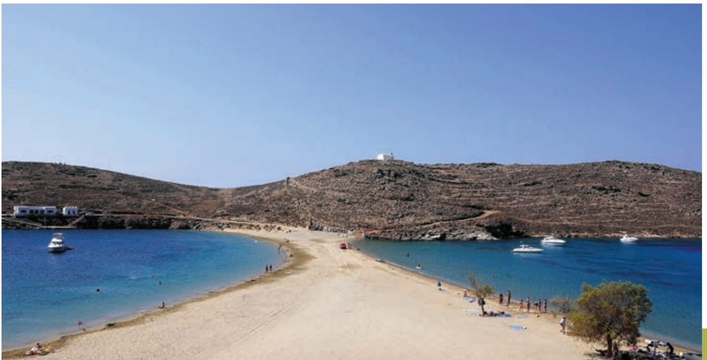
Η παραλία Κολώνα

Τα σχέδια δεν σταματούν εδώ, καθώς η Κύθνος τώρα ξεκινά την ένταξή της στον τουριστικό χάρτη, ουσιαστικά και οργανωμένα: «Στόχος μας ως δημοτική αρχή, είναι το νησί να αποκτήσει τουριστική ταυτότητα. Θέλουμε να κάνουμε την Κύθνο να έχει αναγνωρισιμότητα. Αυτά τα δύο τρία τελευταία χρόνια προσπαθούμε και οι πολιτιστικές εκδηλώσεις που διοργανώνουμε, όχι μόνο να δώσουν τη δυνατότητα στον κόσμο που έρχεται εδώ να περάσει καλά, αλλά και να αποτελέσουν ένα μέσο για την προβολή και διαφήμιση του νησιού μας». Επόμενος στόχος είναι να αξιοποιηθούν μέσα από συγχρηματοδοτούμενα προγράμματα οι ιαματικές πηγές και να αναδειχθεί το σπήλαιο «Καταφύκι», που είναι ένα από τα μεγαλύτερα και αξιολογότερα σπήλαια της Ελλάδας.