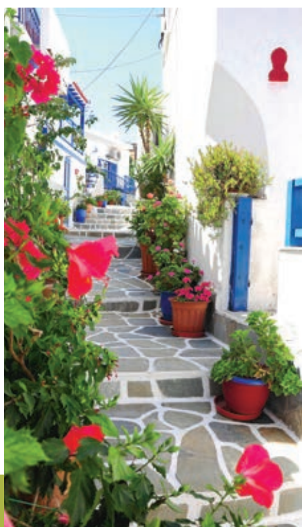
σοκάκι της Δρυοπίδας

Το έργο της αποκατάστασης του ΧΑΔΑ βρίσκεται στο στάδιο της υλοποίησης, ενώ αναμένεται σύντομα η δημοπράτηση της προμήθειας του εξοπλισμού. Ο δήμαρχος επισημαίνει ότι ήδη έχουν ξεκινήσει ενέργειες προκειμένου να ελαχιστοποιηθεί η ανάγκη χρήσης άρα και ο όγκος των πλαστικών μπουκαλιών, ενώ προγραμματίζεται ένα πρόγραμμα εκπαίδευσης με μπόνους στα σχολεία του νησιού.