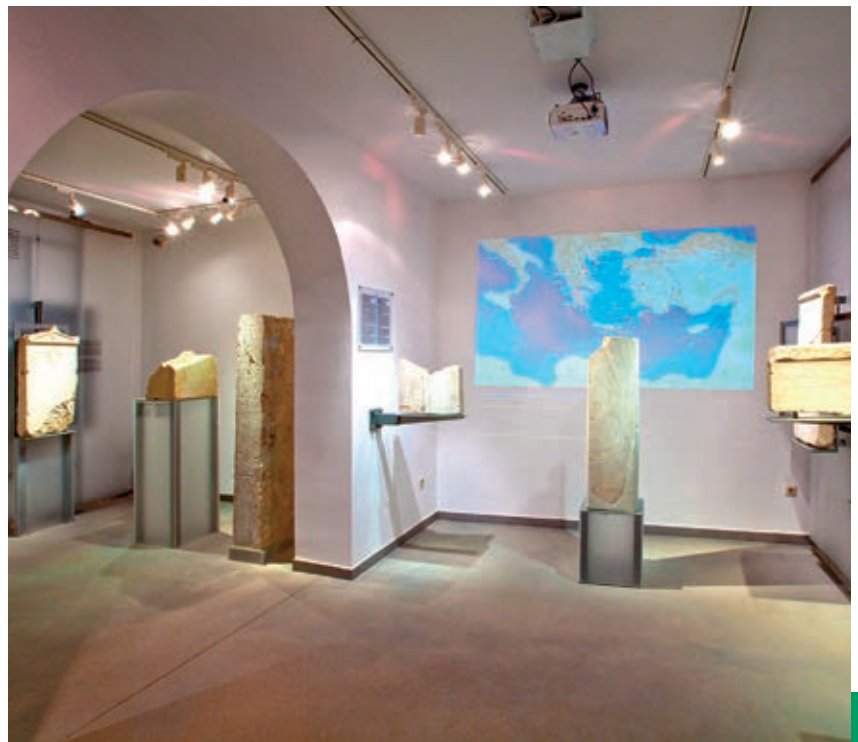
Επιγραφική συλλογή στο Ασκληπιείο

συντηρήθηκε και αποκαταστάθηκε σταδιακά, με εθνικούς πόρους (1975-1985) και πόρους του ΠΕΠ Νότιου Αιγαίου 2000-2006. Στη συνέχεια ο αναγνώστης ενημερώνεται για τις τέσσερις οικοδομικές φάσεις της Οικίας (ελληνοιστική, περίοδος 142 μ.Χ. – 3ος αι. μ.Χ., ύστερος 3ος – μέσα 4ου αι. μ.Χ., τελική φάση μετά το 365 μ.Χ.), τον εξαιρετικό διάκοσμό της (μαρμαροθετήματα, ψηφιδωτά, τοιχογραφίες, γλυπτά) και τις εργασίες συντήρησης. Την επιμέλεια του εντύπου είχε ο Παύλος Τριανταφυλλίδης και τα κείμενα ο ίδιος, η Μαρία Τσιριμώνα και η Ειρήνη Νικολοπούλου. Τη μετάφραση στα αγγλικά η Alexandra Doulmas.