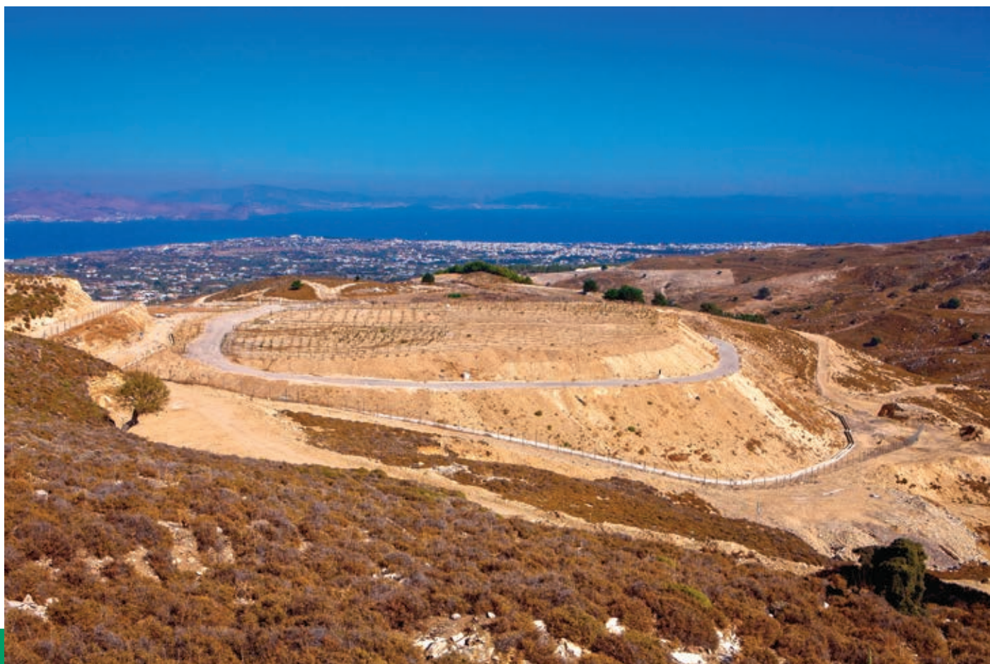
Αποκατάσταση ΧΑΔΑ στο Κοκκινόνερο

και ενοποίηση υπαρχόντων ποδηλατόδρομων, αποκατάσταση πάρκων, ανακαίνιση κτιρίου φιλαρμονικής και δημιουργία κέντρου ηλεκτρονικής τεκμηρίωσης, αναπλάσεις σε πλατείες και πολλά ακόμα).