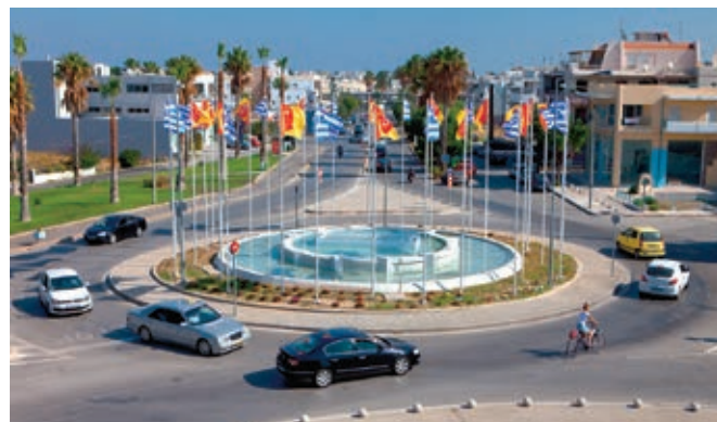
Ο κόμβος στην είσοδο της πόλης

Το μεγαλύτερο από άποψη προϋπολογισμού έργο (20.54 εκ. €) είναι η κατασκευή δικτύων αποχέτευσης και οι εγκαταστάσεις επεξεργασίας διάθεσης λυμάτων στη δημοτική ενότητα Δικαίου, που συνολικά θα εξυπηρετούν 25,000 κατοίκους. Το έργο υλοποιείται ήδη, προχωρά με γοργούς ρυθμούς αλλά θα ολοκληρωθεί το 2016, στο πλαίσιο της επόμενης προγραμματικής περιόδου.