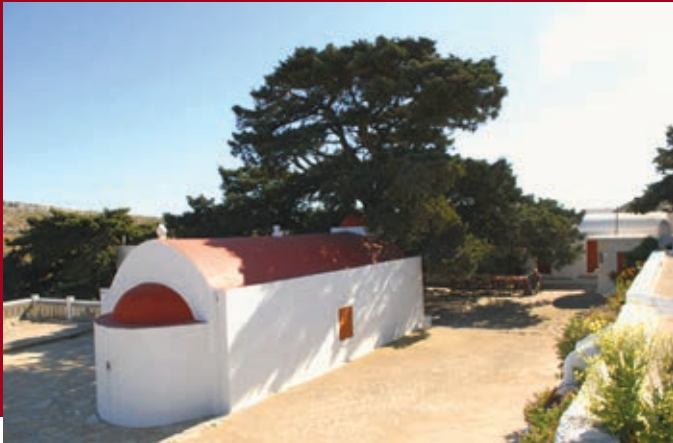
Μοναστήρι Άη Γιάννη Αλάργα

έχει αναλάβει ως δικαιούχος το Γ.Ν. Ρόδου και βρίσκεται στο στάδιο αξιολόγησης προσφορών. Λόγω του ότι δεν τελείωσε μέσα στα χρονικά όρια του ΕΣΠΑ 2007-2013, το έργο θα ολοκληρωθεί από εθνικούς πόρους.