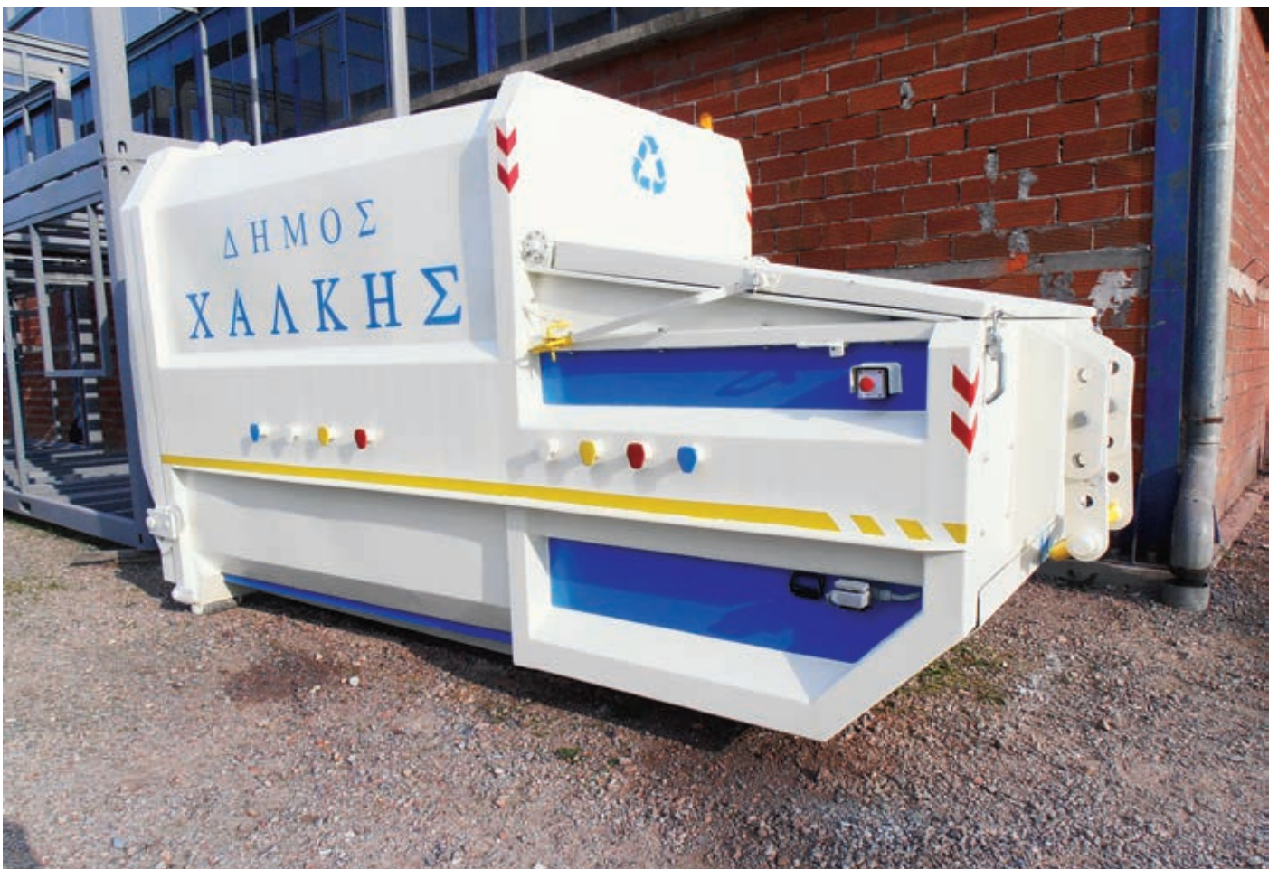
Εξοπλισμός διαχείρισης απορριμμάτων

Τέλος από το ίδιο Πρόγραμμα εγκαταστάθηκε στην περιοχή Κάνια μονάδα αφαλάτωσης η οποία έχει δυναμικότητα 600 κυβικών μέτρων νερού ανά ημέρα, με στόχο να προσφέρει ανάσα στο υδρευτικό πρόβλημα του νησιού. Παράλληλα εγκαταστάθηκε και μια προκατασκευασμένη δεξαμενή ύδρευσης χωρητικότητας 700 κυβικών μέτρων, ενώ υλοποιήθηκαν όλες οι απαραίτητες εργασίες (κατασκευή αγωγών, γεωτρήσεις, σύνδεση με δίκτυα) ώστε το έργο να γίνει λειτουργικό.