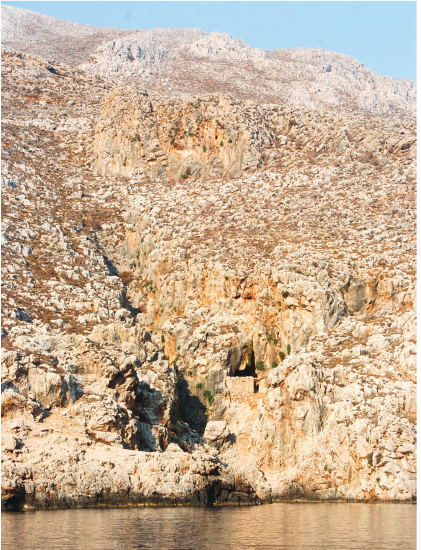
Σπηλιά στην περιοχή Κελιά - Παλιό ασκητήριο με αγιογραφίες πάνω στους βράχους