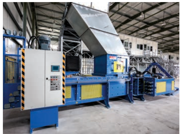
ΚΔΑΥ Ρόδου

λογή στην πηγή σε κάδους ανακύκλωσης. Περιλαμβάνει μεταλλικό κτίριο 1.250 τ.μ., προκατασκευασμένο κτίριο γραφείων και χώρων προσωπικού, ειδικές κτιριακές και ηλεκτρομηχανολογικές εγκαταστάσεις, διαμόρφωση του περιβάλλοντος χώρου, αλλά και τον απαιτούμενο σταθερό και κινητό εξοπλισμό που εξασφαλίζει τη σωστή