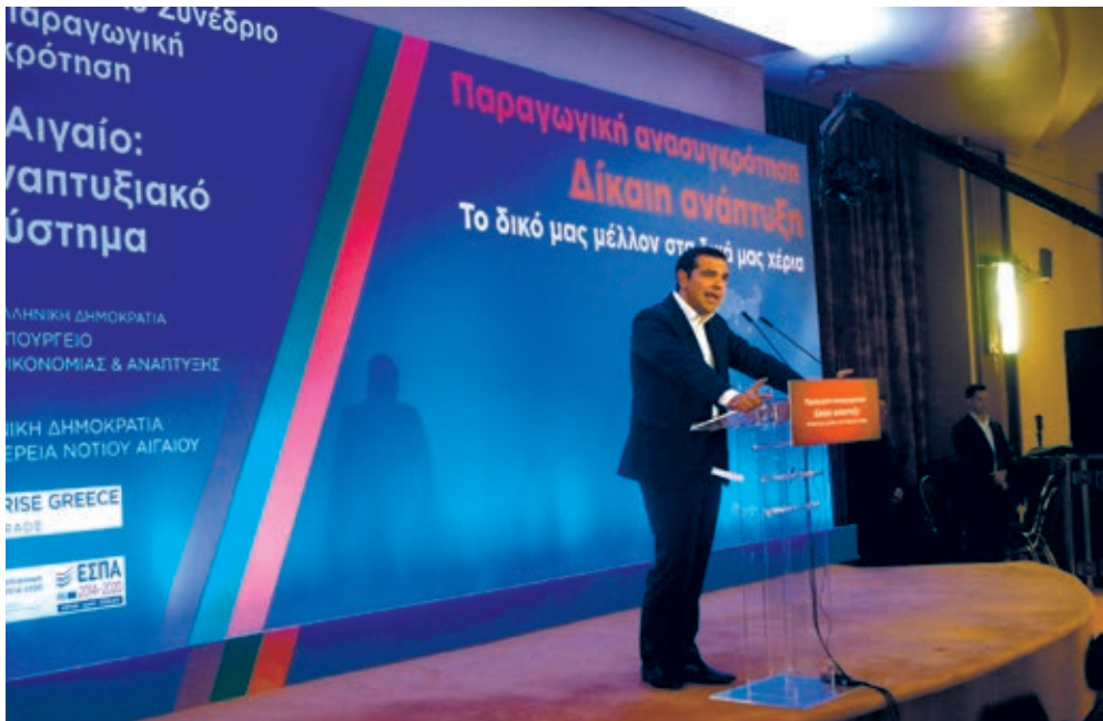
Ο πρωθυπουργός Αλέξης Τσίπρας στην κεντρική του ομιλία στη Ρόδο