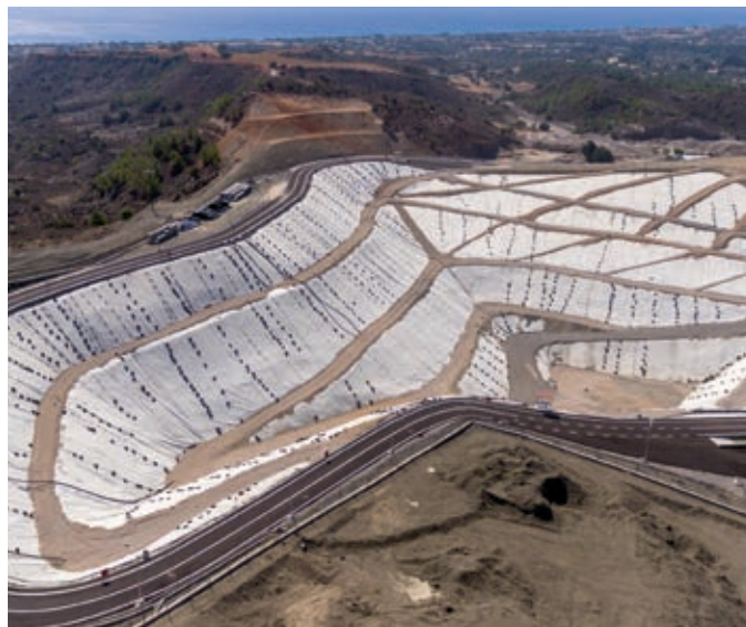
ΧΥΤΑ Νότιας Ρόδου

Η προσπάθεια για την περιβαλλοντική αναβάθμιση της Ρόδου, συνεχίζεται και στην τρέχουσα προγραμματική περίοδο, καθώς έχει υποβληθεί προς ένταξη στο Επιχειρησιακό Πρόγραμμα ΥΜΕΠΕΡΑΑ 2014-2020 η πρόταση «Ολοκληρωμένο Σύστημα Διαχείρισης Αστικών Αποβλήτων Νήσου Ρόδου», προϋπολογισμού 36,4 εκ. €. Ένα μεγάλο έργο που περιλαμβάνει την επέκταση του ΧΥΤΑ Βόρειας Ρόδου, μια Μονάδα Επεξεργασίας Απορριμμάτων και μια Μονάδα Κομποστοποίησης Προδιαλεγμένων Οργανικών στον Δήμο Ρόδου.