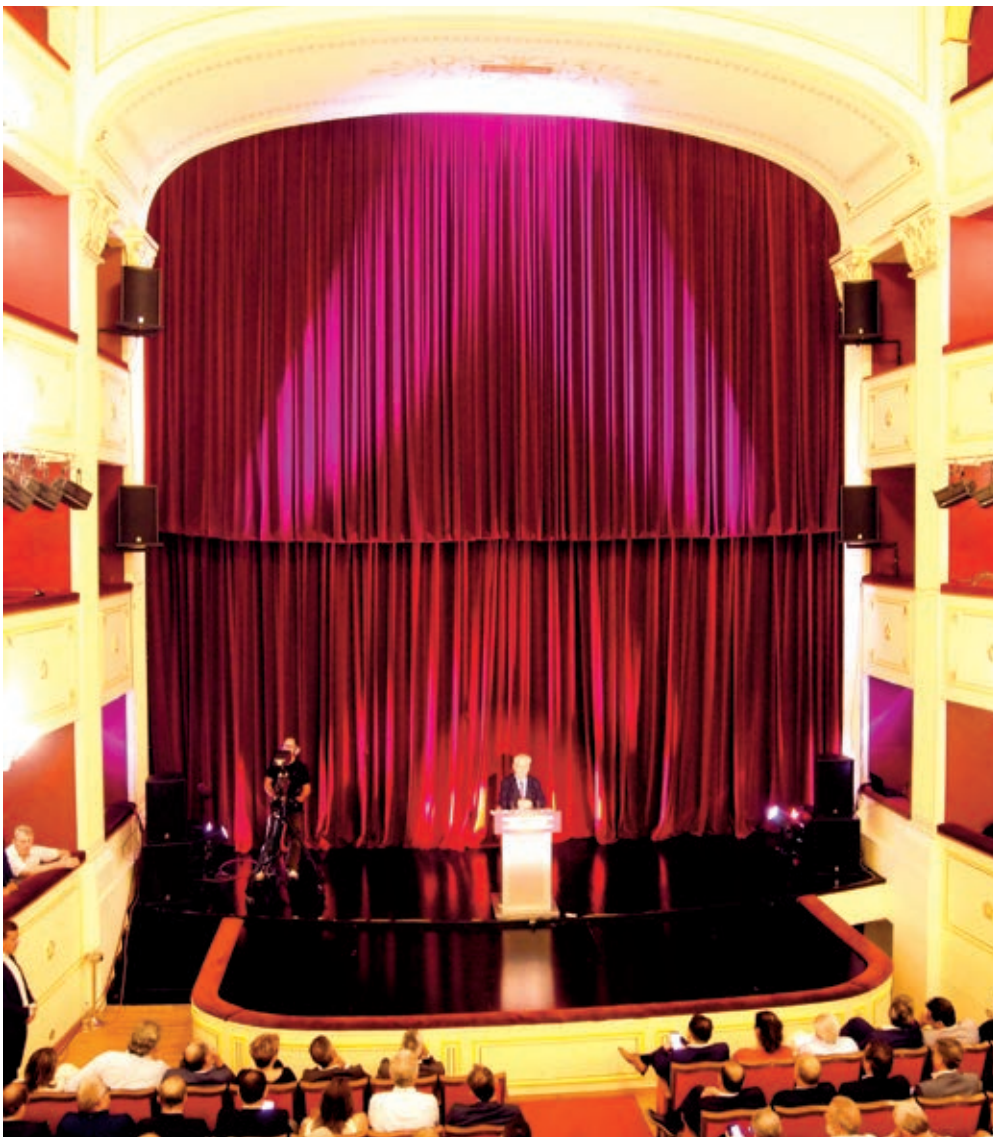
Ο Αντιπρόεδρος της Κυβέρνησης Γιάννης Δραγασάκης κλείνει το συνέδριο στη Σύρο

χέρι τις ιδιαιτερότητες, τα προβλήματα και τις προοπτικές του κάθε τόπου.