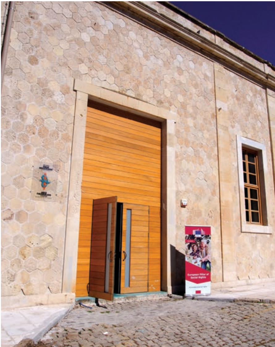
Η είσοδος του θεάτρου Μίκης Θεοδωράκης