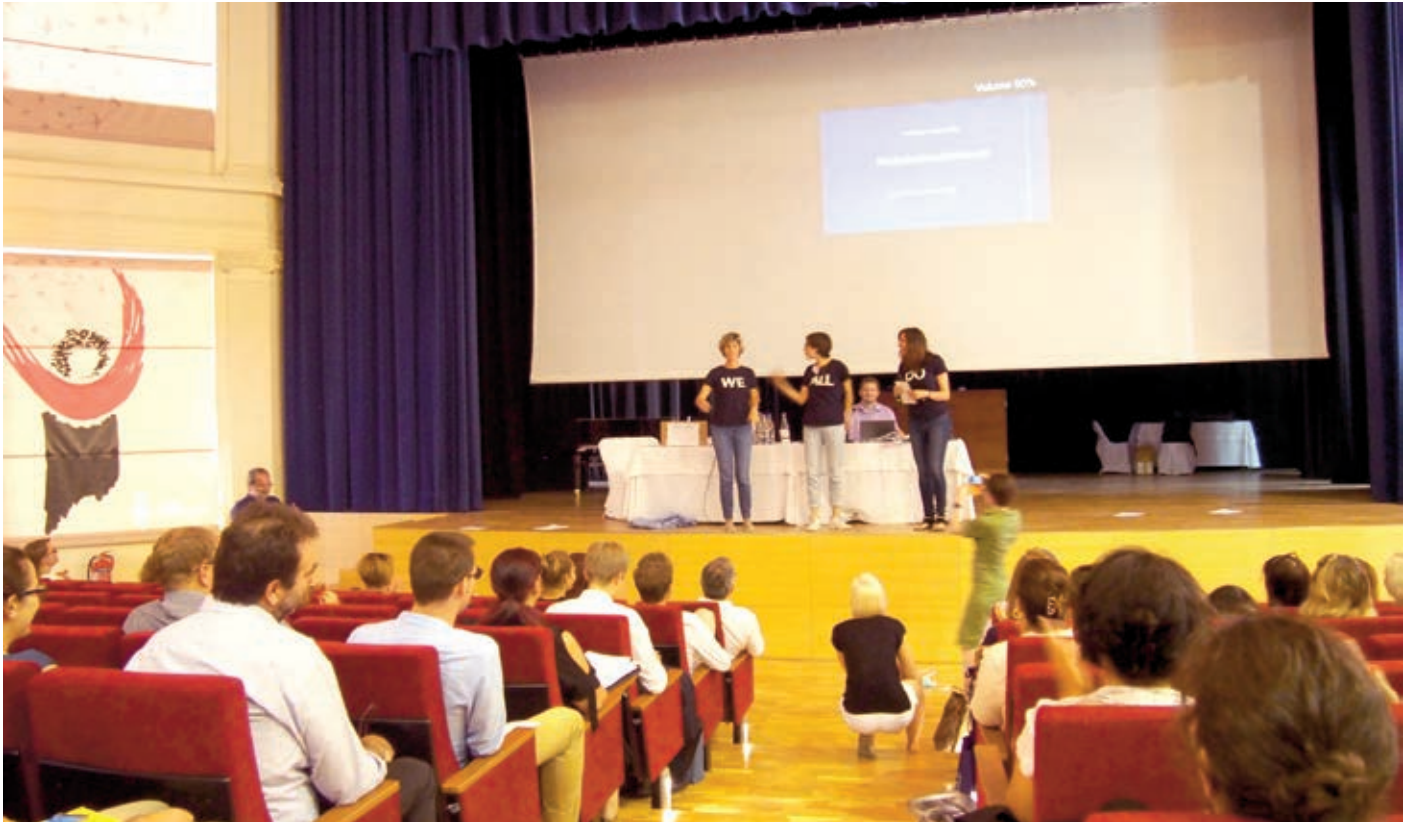
Από την παρουσίαση του "Inclusive growth: Does anyone care about this?"