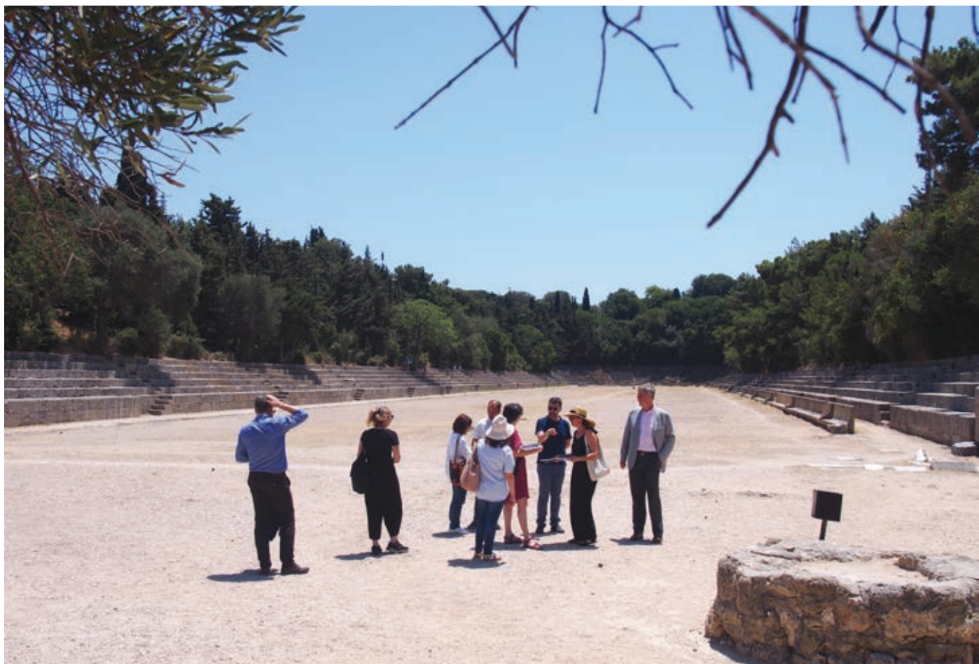
Το Στάδιο (από την επίσκεψη των αξιωματούχων της Ε.Ε. στον αρχαιολογικό χώρο)

Όλες αυτές οι παρεμβάσεις δημιούργησαν δομικά προβλήματα λόγω γήρανσης του υλικού αλλά και αστοχιών στην επιλογή και την εφαρμογή των υλικών. Πέρα από αυτό, παρατηρούνται μηχανικές φθορές εξαιτίας σεισμών ή διόγκωσης λόγω οξείδωσης των σιδερένιων συνδέσμων. Ακόμα, χημικές μορφές διάβρωσης των αρχαίων μελών κυρίως από την όξινη βροχή και την ατμοσφαιρική ρύπανση. Βιολογικές βλάβες προκαλούνται από τις λειχήνες, τους μύκητες αλλά κι από ρίζες φυτών και τα εκχύματά τους.