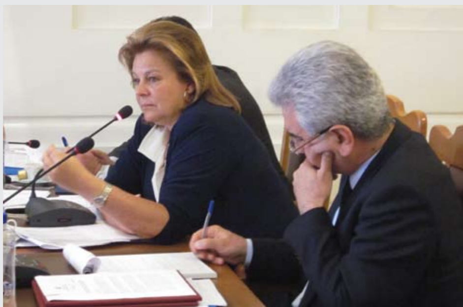
Η Υπουργός κα Λούκα Κατσέλη και ο Περιφερειάρχης κ. Γιάννης Μαχαίριδης από την πρόσφατη συνεδρίαση του Περιφερειακού Συμβουλίου στη Ρόδο.

Βασικός στόχος τους είναι η προετοιμασία της στήριξης ανέργων προκειμένου να ενταχθούν στην αγορά εργασίας, καθώς