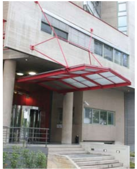
Τα γραφεία της ΜΟΔ βρίσκονται στην οδό Λ. Ρισανκούρ στην Αθήνα.

μικού Ελέγχου, Ειδικές Υπηρεσίες Διαχείρισης κλπ. και διαπιστώνεται πάντοτε η άριστη εφαρμογή των συστημάτων διαχείρισης και ελέγχου των έργων καθώς και η χρηστή οικονομική διαχείριση των πόρων.