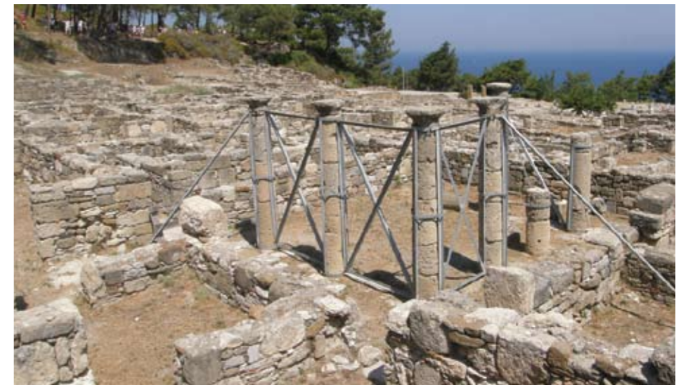
Περιτύλιο αρχαίας οικίας μετά την υποσύλωση των κίωνων του.

Έτσι λοιπόν με πόρους του Επιχειρησιακού Προγράμματος Κρήτης & Νήσων Αιγαίου, η ΚΒ' Εφορεία Προϊστορικών και Κλασικών Αρχαιοτήτων ανέλαβε να καθαρίσει, να συντηρήσει και να αποκαταστήσει όλον τον επισκέψιμο αρχαιολογικό χώρο. Όπως είναι αυτονόητο, ένας τέτοιος χώρος χρειάζεται ιδιαίτερη φροντίδα. Ήδη, παρουσιάζει σοβαρά προβλήματα, κυρίως κατακρημνίσεις και φθορές τοίχων, έντονη διάβρωση του εδάφους στην ακρόπολη, ρηγματώσεις στα περιτύλια κ.ά., προβλήματα που οφείλονται τόσο στη φθορά του χρόνου, όσο και στα όμβρια ύδατα τα οποία ρέουν από την ακρόπολη προς τον αρχαιολογικό χώρο, αλλά και σε πυρκαγιά που ξέσπασε το Δεκέμβριο του 2008. Η συνολική έκταση των 25 στρεμμάτων πρόκειται πλέον να καθαριστεί από την αυτοφυή βλάστηση, ενώ θα πραγματοποιηθεί στερέωση, ανάταξη και συντήρηση των τοίχων των αρχαίων οικιών και των δημόσιων κτιρίων και θα γίνουν μελέτες αποκατάστασης των αναστηλωμένων κτιρίων του ναού του Πυθίου Απόλλωνος και των περιτυλίων.