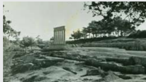
Η μεγάλη στοά της ακρόπολης με αναστηλωμένο μέρος της κιονοστοιχίας της από τους Ιταλούς. Κατέπεσε από καταιγίδα το 1968.

Την αξιοποίηση ενός σπουδαίου κέντρου της Αρχαϊκής και της Ελληνιστικής εποχής ως επισκέψιμο χώρο έχει στόχο το έργο «αποκατάσταση - ανάδειξη αρχαιολογικού χώρου Καμείρου Ρόδου», που εντάχθηκε στο Επιχειρησιακό Πρόγραμμα Κρήτης & Νήσων Αιγαίου 2007-2013 με προϋπολογισμό 1,2 εκ. €. Το έργο αυτό, στο δεύτερο (μετά τη Λίνδο) από πλευράς επισκεψιμότητας αρχαιολογικό χώρο της Ρόδου, που υλοποιείται ήδη από την ΚΒ' Εφορεία Προϊστορικών και Κλασικών Αρχαιοτήτων (ΕΠΚΑ) του Υπουργείου Πολιτισμού και Τουρισμού, αναμένεται να αυξήσει ακόμη περισσότερο το ενδιαφέρον των επισκεπτών της περιοχής.