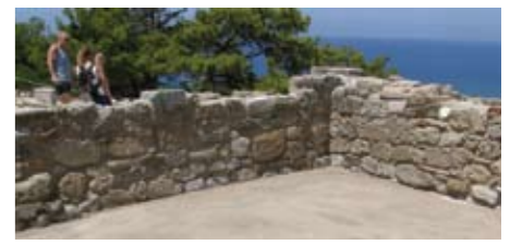
Τρεις διαδοχικές φάσεις επίστρωσης δαπέδου στο εσωτερικό δωματίου αρχαίας οικίας.